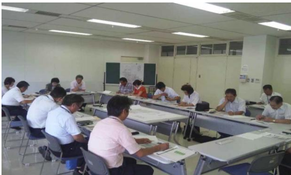
「人・農地プラン」検討会の様子 プラン作成は県内で唯一（H24.10.5現在）